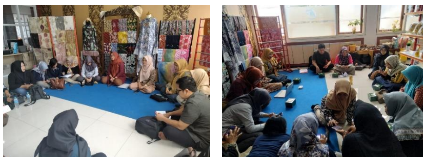
Gambar 1. Pelatihan Canva & Google Drive

Peserta pengabdian masyarakat merupakan pelaku UMKM di wilayah Kabupaten Madiun. Mereka terdiri dari pelaku usaha pembuatan batik, bakso lele, wayang, dan makanan ringan. Para pelaku UMKM ini telah melakukan pemasaran produknya dengan baik akan tetapi pelaksanaannya belum maksimal sehingga volume penjualan belum mencapai yang diharapkan. Sebagai contoh, para pelaku UMKM memasarkan produknya dengan foto produk seadanya sehingga membuat daya tarik masih kurang. Atas dasar kondisi ini tim pengabdian melakukan pelatihan mendesain dengan aplikasi canva . Para peserta sangat tertarik untuk menggunakan canva dalam mendesain foto produknya. Para peserta menyukai penggunaan aplikasi canva yang mudah dan praktis serta banyak template-template desain yang bagus dan gratis. Dari hasil kegiatan tersebut dapat dilihat bahwa para peserta semakin antusias dalam mendesain foto produknya. Hal ini dapat terlihat dari para peserta yang menghasilkan foto produk yang sudah didesain lebih dari satu dan langsung dishare di media sosial mereka. Adapula peserta yang mencatat langkah-langkah dalam penggunaan aplikasi tersebut. Hasil kegiatan ini sama dengan hasil kegiatan dari Choirina, Rohman, Tjiptadi, Fadliana, dan Wahyudi (2022), dan Zettira, Febrianti, Anggraini, Prasetyo, dan Tripustikasari (2022)